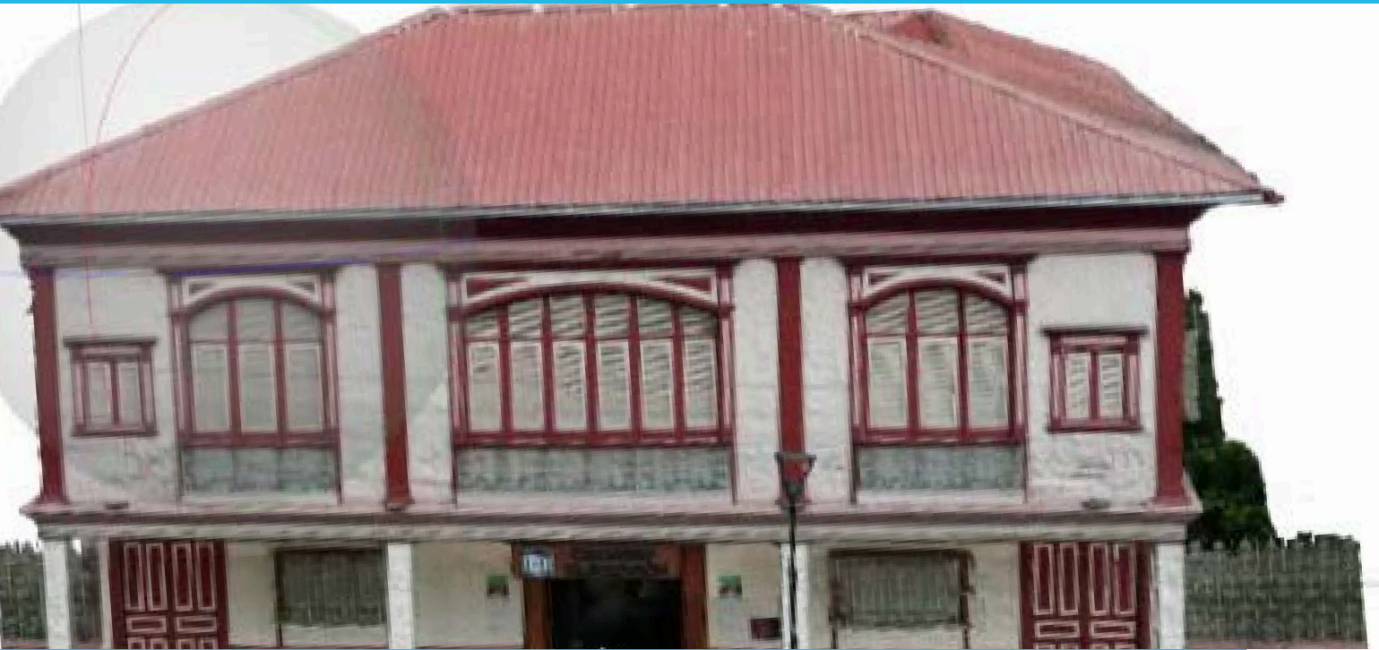
Fotogrametría de la Casa Museo de Samborondón construida en 1911