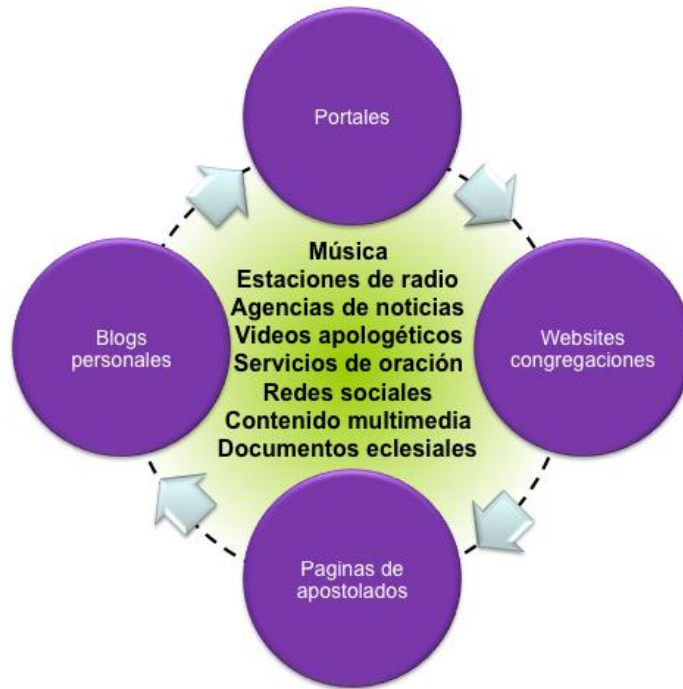
Ilustración 2 Principales herramientas de Evangelización