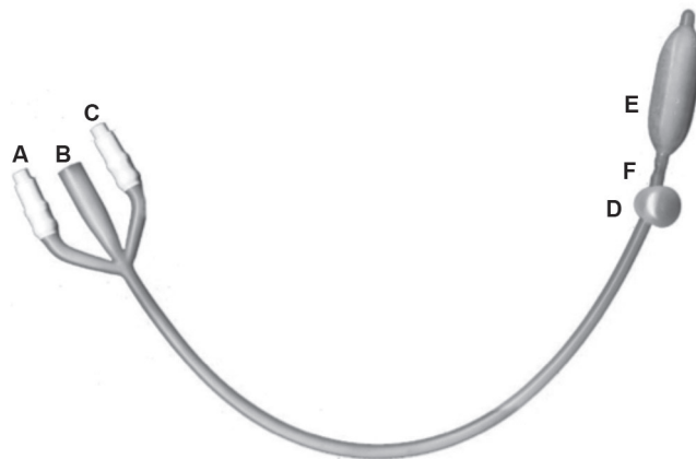
Figura 1. Catéter para medir presión intraabdominal. A. Válvula de llenado del globo de anclaje, B. Tubo de drenaje, C. Válvula de llenado del globo de medición, D. Globo de anclaje, E. Globo de medición, y F. Orificio de drenaje.