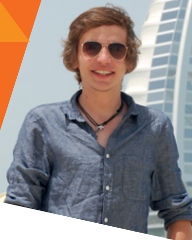
Emiratos Árabes Unidos

+ de 300 opciones de intercambios en la Red de Universidades Anáhuac