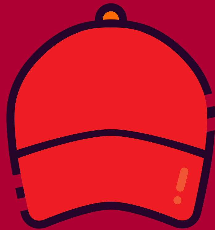
Combate de Incendios GORRA ROJA