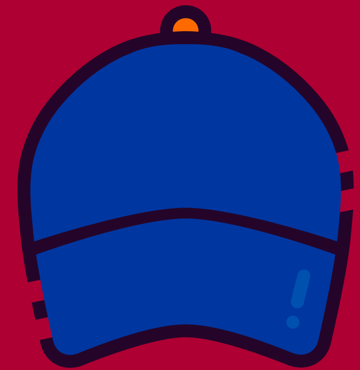
Búsqueda y Rescate GORRA AZUL