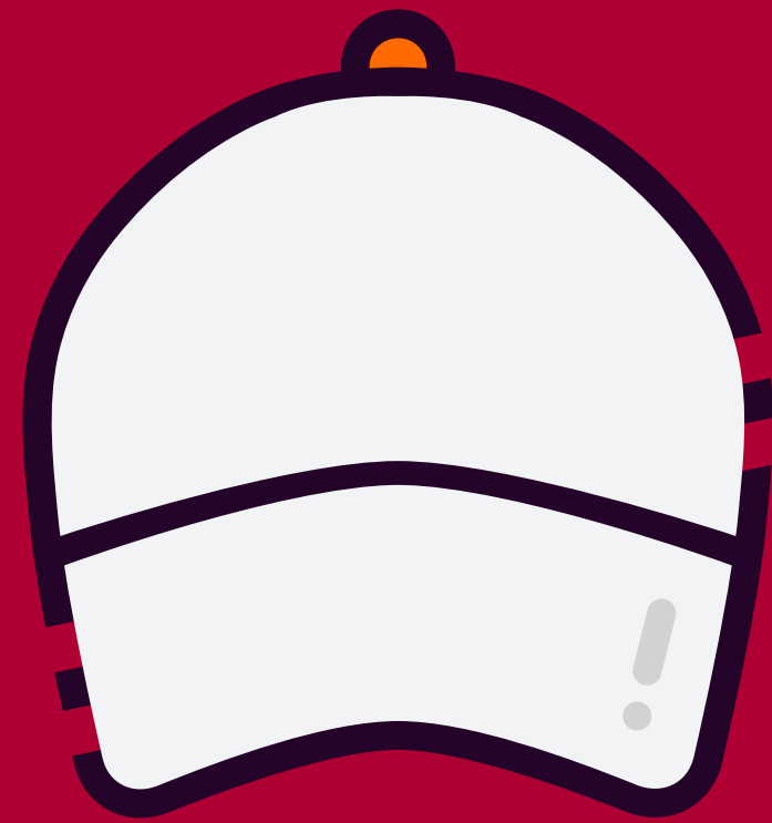
Primeros Auxilios GORRA BLANCA