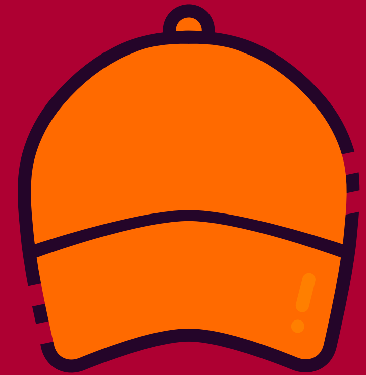
Evacuación GORRA NARANJA