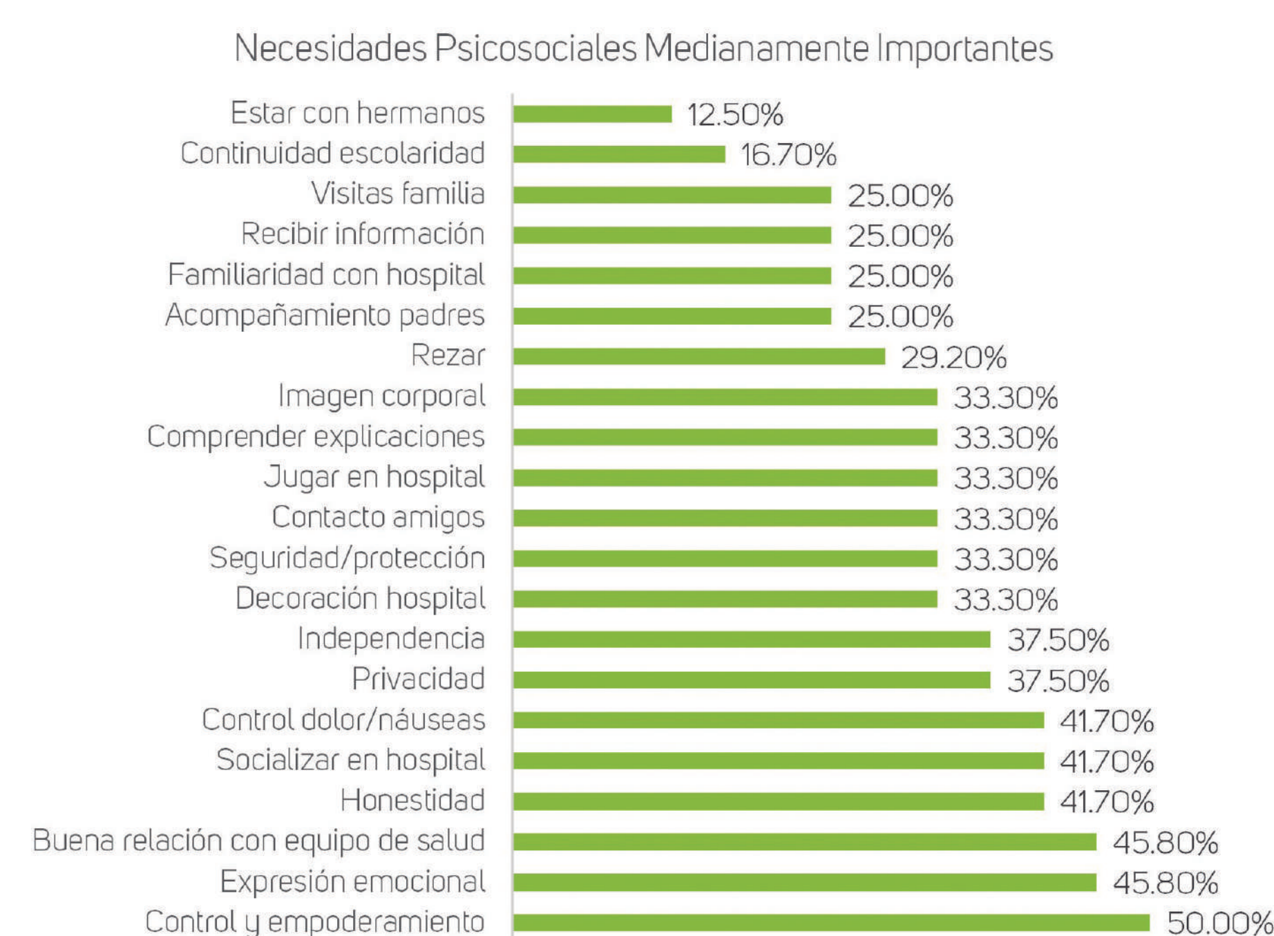
Figura 2. Porcentajes de necesidades psicosociales medianamente importantes.