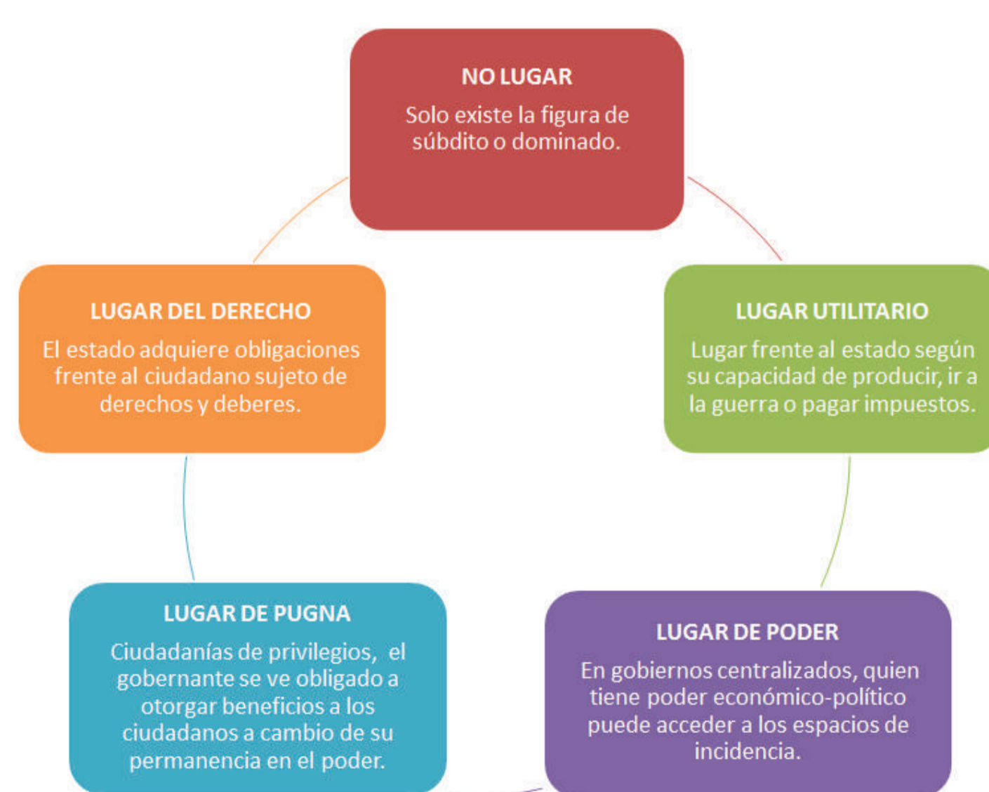
Figura 1. Lugares simbólicos de la ciudadanía en diferentes momentos históricos.

El lugar simbólico del ciudadano frente al estado ha sido cambiante en diferentes momentos históricos (figura 1).