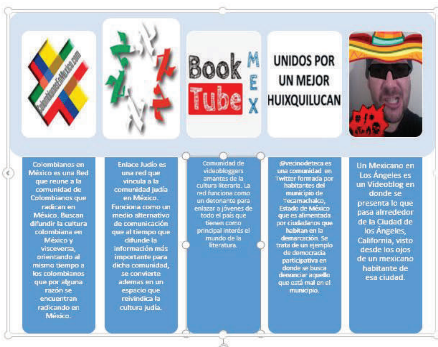
Cuadro 2. Ejemplos de comunidades virtuales generadas en México

Debido a esto, una parte de esa comunidad recurre al uso de la tecnología para crear redes socio-digitales de colaboración e intercambio de capital social, el cual define Bourdieu (1985) como el agregado de los recursos reales o potenciales que se vinculan con la posesión de una red duradera de relaciones más o menos institucionalizadas de conocimiento o reconocimiento mutuo. Por ello, esta investigación analiza la manera en que los venezolanos radicados en México forjan estos espacios virtuales, que se constituyen como sitios de socialización y de protesta, en donde suelen discutir la situación que atraviesa su país.