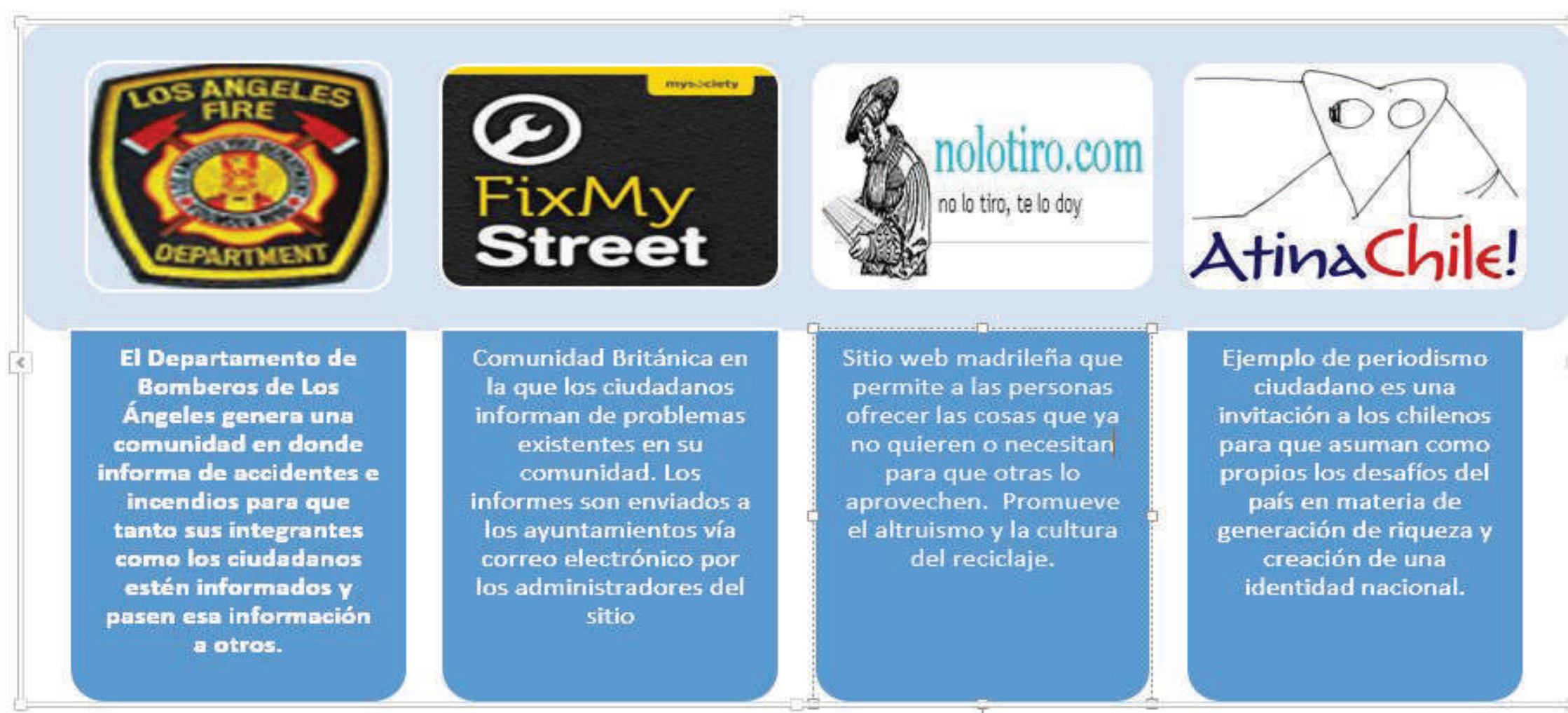
Cuadro 1. Ejemplos de comunidades virtuales existentes en algunas partes del mundo. Con información de Paz Pellat (2009)

La presencia de la comunidad venezolana en México se ha incrementado últimamente, fenómeno que coincide con el crecimiento de los conflictos sociales que se viven en Venezuela. Al respecto, Mario Madrazo, director de verificación del Instituto Nacional de Migración, aseguró que en los primeros cuatro meses del año ingresaron al país 28 mil 571 personas provenientes de aquel país (Vega, 2017).