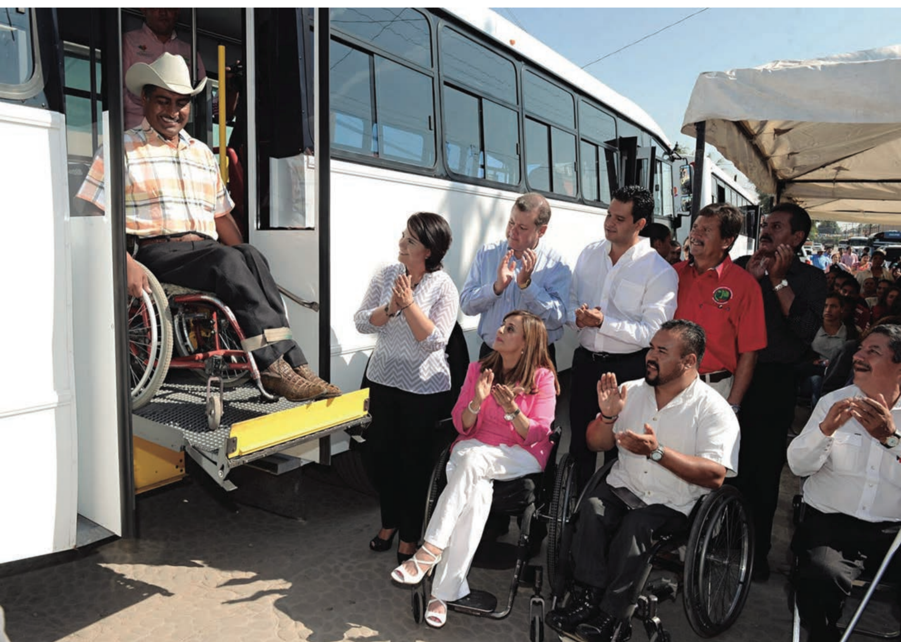
Figura 1. Rampa para discapacitados en autobús urbano.

Se hizo un estudio sobre los transportes ya existentes para personas discapacitadas y se realizaron matrices comparativas para concluir cuales de éstas deberían de mejorar, cambiar e innovar en BOB para así hacerlo más práctico y funcional.