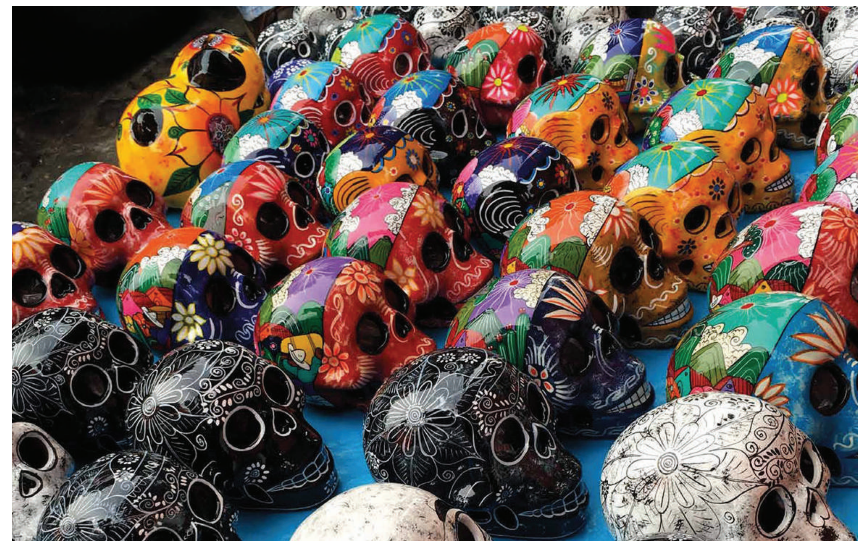
Figura 2. Artesanías.