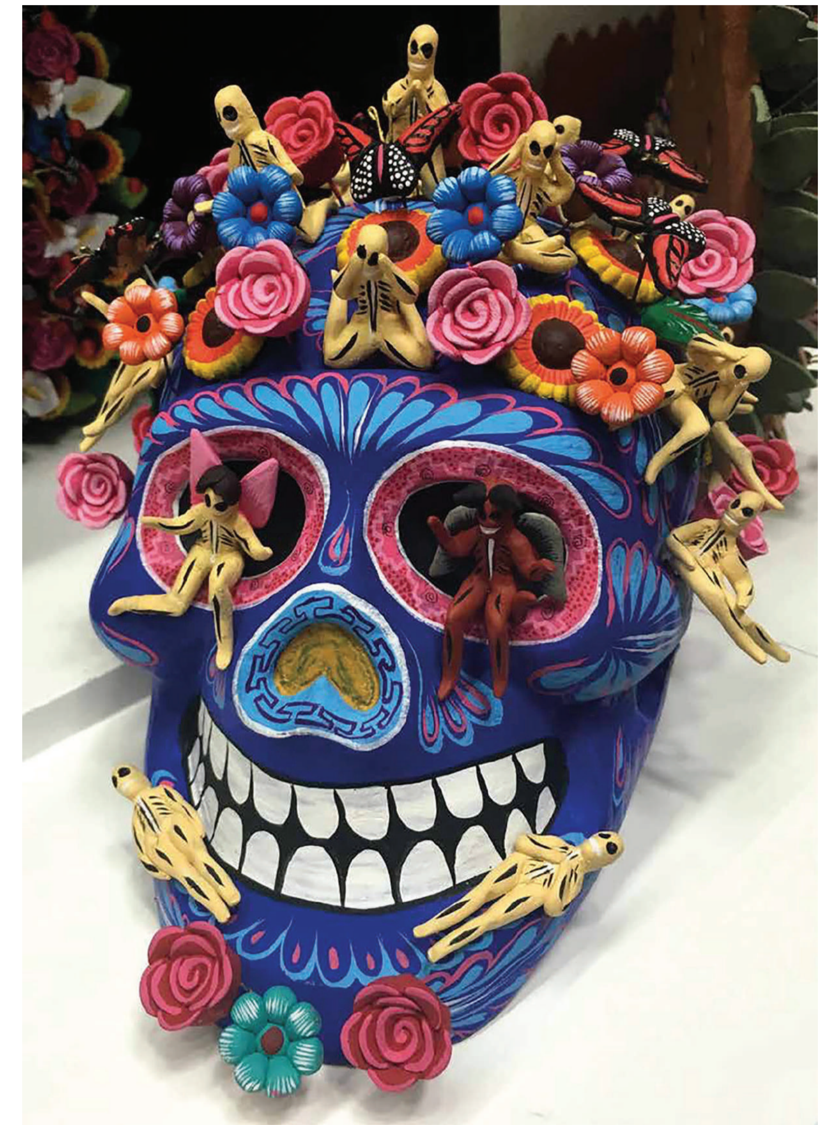
Figura 1. Calavera mexicana.

La investigación realizada fue de gran utilidad para llegar al concepto buscado, ya que mediante la obtención de información y la profundización de términos se lograron determinar ciertos procesos de diseño con respecto a la producción y los procedimientos gráficos. La lluvia de ideas permitió conceptualizar el proyecto en un ambiente 100% mexicano, que cumple con el fin de comunicar la esencia de México en el mundo, transmitiendo una parte de nuestra cultura.