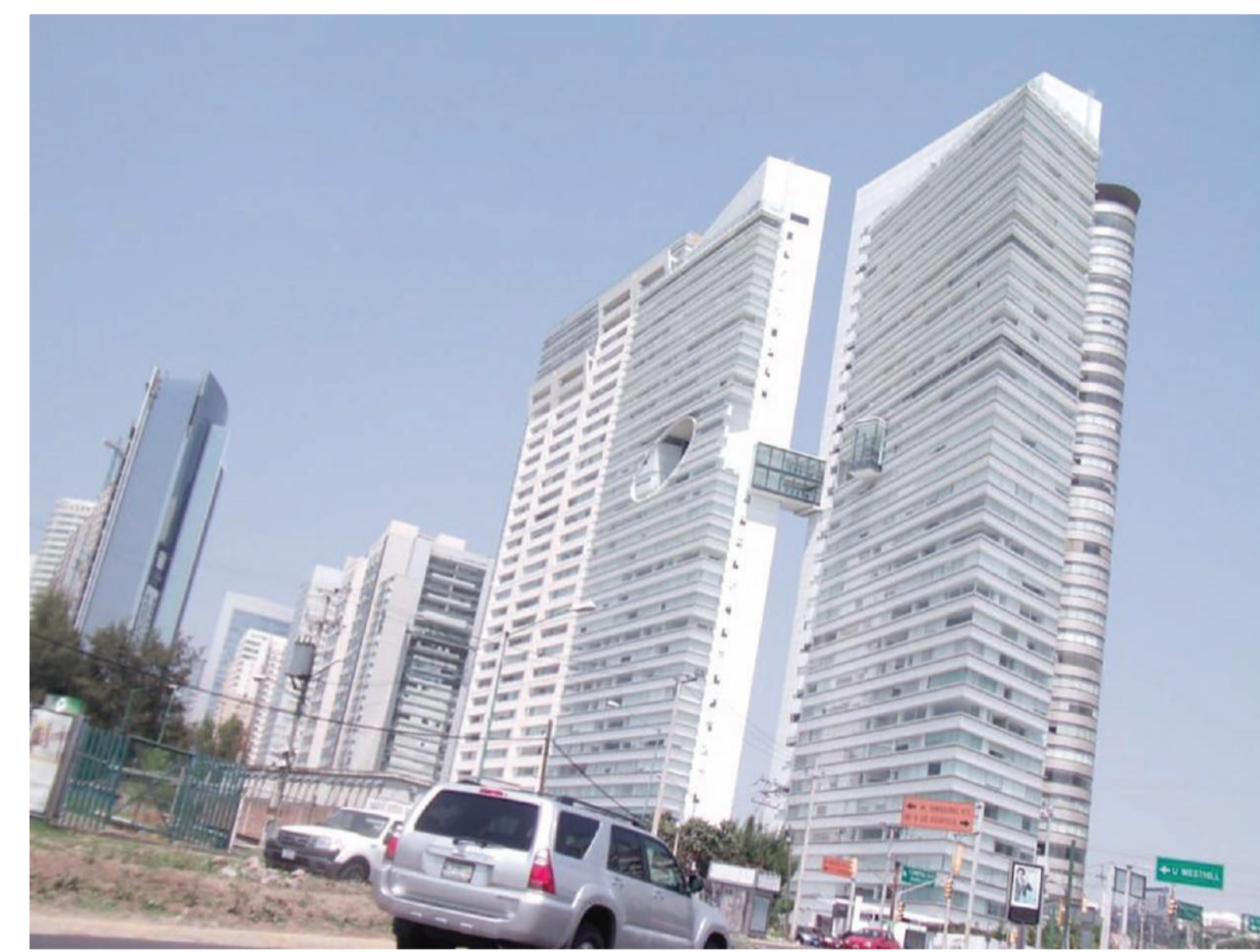
Figura 2. Vivienda de los sectores altos.

En los sectores marginados o de estrato social bajo surgió la vivienda de autoconstrucción y autoproducción, y en algunos casos de producción por el Estado (ISSSTE, Infonavit), muchas de ellas situadas en la periferia de la ciudad. En el nivel medio se construyeron conjuntos habitacionales horizontales cerrados y conjuntos mixtos, cuyo tipo de producción ha sido por encargo, promocional privada y/o promocional del Estado. En los sectores altos surgieron las cerradas en altura en ciertas colonias de la elite de la ciudad, que se enfocaron en poner un límite más estricto en lo referente a la relación entre la intimidad y lo social: colonias y fraccionamientos cerrados, edificios cerrados en altura y las city towers .