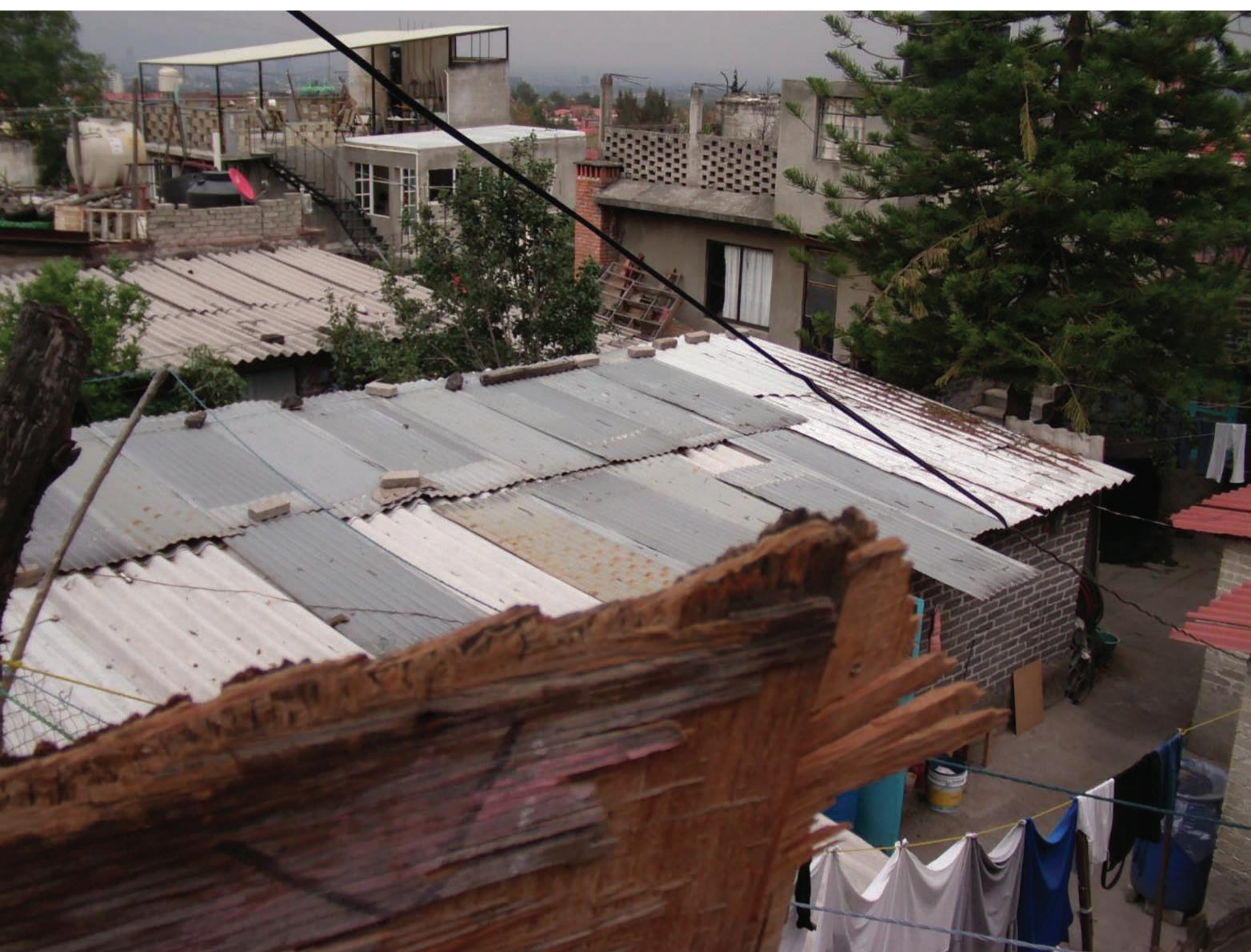
Figura 1. Vivienda de autoconstrucción de pobreza extrema.

Los sismos ocurridos en 1985 constituyen un parteaguas en la historia del país, ya que la experiencia hizo concientizar a la sociedad de todas las deficiencias en cuestiones reglamentarias que generaron grandes pérdidas económicas y humanas. Como consecuencia, se han ido conformando, de forma correlacional y al unísono, nuevas políticas públicas que han favorecido la creación de programas gubernamentales que, a su vez, han generado la creación de empresas inmobiliarias y de diseño que han cambiado por completo la estructura urbana y arquitectónica de la forma de habitar en la Ciudad de México durante los últimos treinta años.