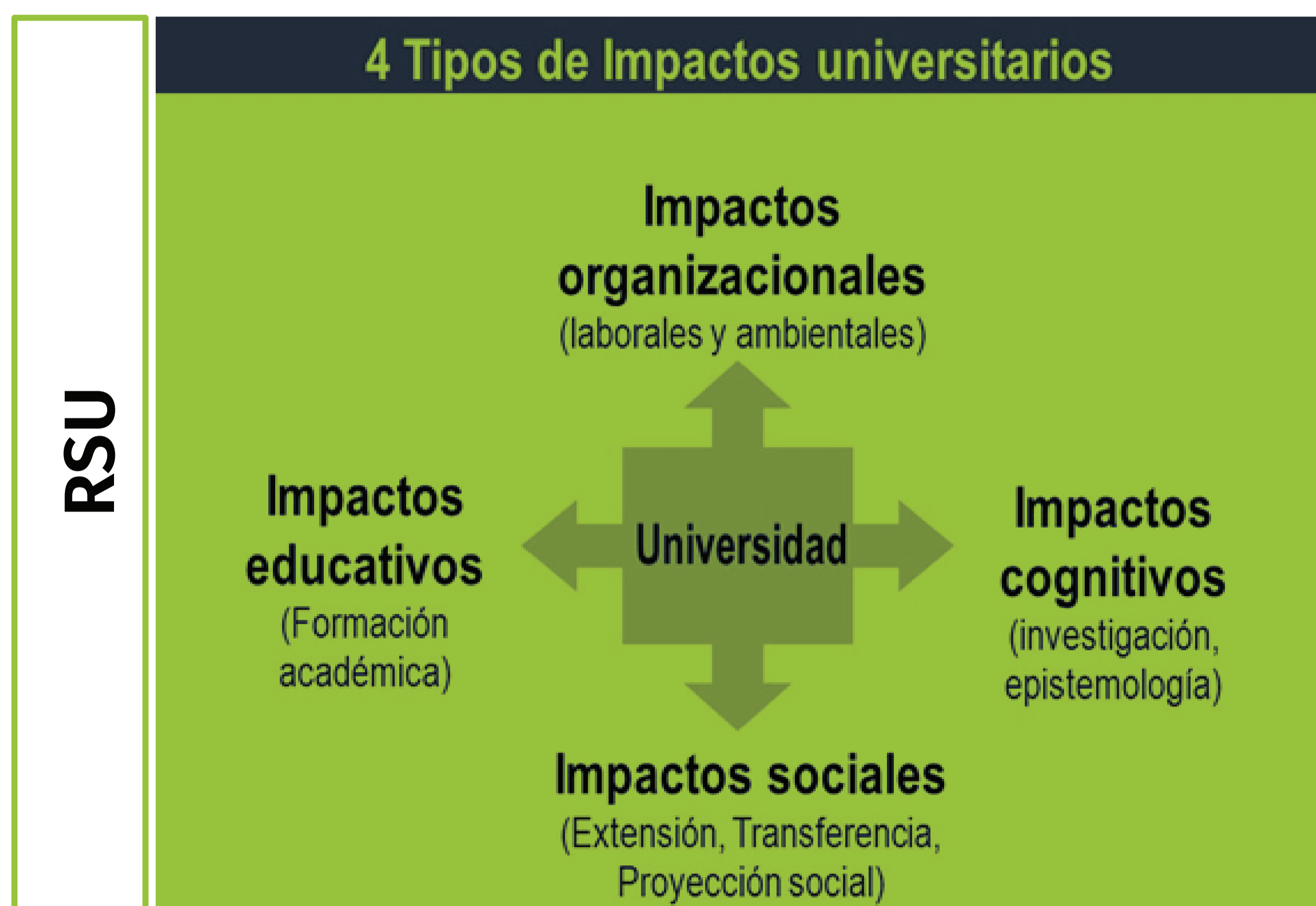
Figura 1. Impactos de la RSU. Fuente: adaptado de Vallaeys (2009).