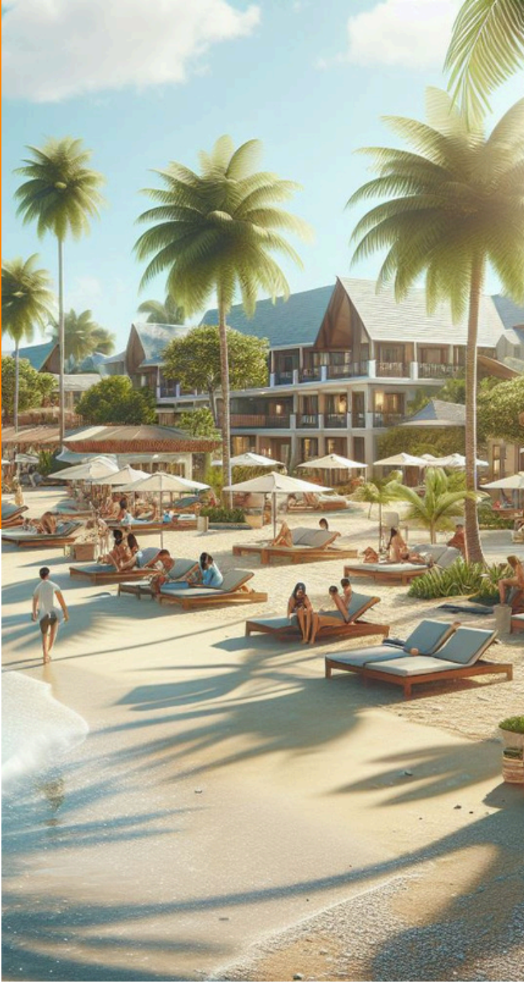
Crecimiento del consumo turístico interno Tercer trimestre 2025

Con respecto al segundo trimestre de 2025, el consumo interno tuvo un aumento del 1.70% .