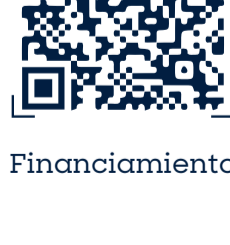
Convenios de descuento