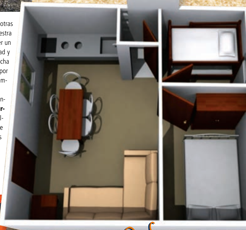
• Render de la casa

ASUA nace como un proyecto de compromiso de la Universidad Anáhuac con la comunidad inmediata, conformando su primer documento oficial en 1970. En 1985, la Universidad Anáhuac toma el