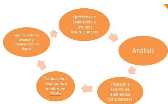
Figura 3 Ciclo de mejora continua

De esta manera se muestra como la institución busca contar con mecanismos que permitan llevar a cabo la evaluación y mejora continua en todos sus ámbitos de acción.