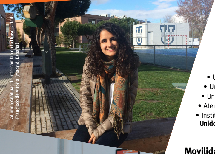
Alumna Anáhuac de intercambio en la Universidad Francisco de Vitoria (Madrid, España)