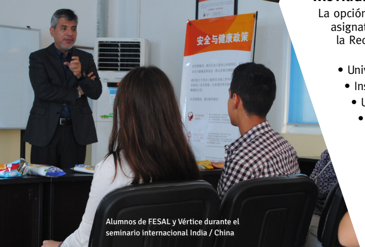
Alumnos de FESAL y Vértice durante el seminario internacional India / China